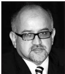
Срджан ДАРМАНОВИЧ , член Венеціанської комісії від Чорногорії, професор факультету права Університету Чорногорії