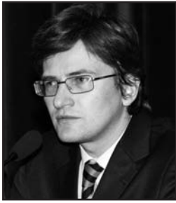
Андрій МАГЕРА, заступник голови Центральної виборчої комісії України