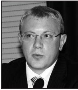
Андрій ШЕВЧЕНКО, перший заступник Голови Комітету Верховної Ради України з питань свободи слова та інформації