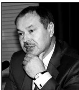
Михайло ЦУРКАН, заступник голови Вищого адміністративного суду України