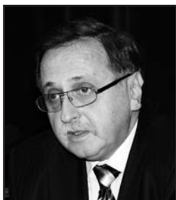
Юрій КЛЮЧКОВСЬКИЙ, заступник голови комітету Верховної Ради України з питань державного будівництва та місцевого самоурядування, президент Інституту виборчого права

Україна не стоїть на одному місці в сфері виборчого законодавства. У Верховній Раді зареєстрований проект Виборчого кодексу, там міститься дуже багато позитивних моментів. Попри все я оптиміст і попри все вірю в те, що президента України буде обрано, багато проблем спільними зусиллями вдасться подолати. ■