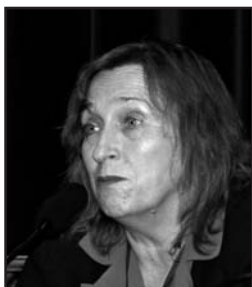
Ірина БЕКЕШКІНА, науковий керівник Фонду «Демократичні ініціативи»