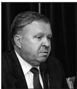
Володимир ШАПОВАЛ, голова Центральної виборчої комісії